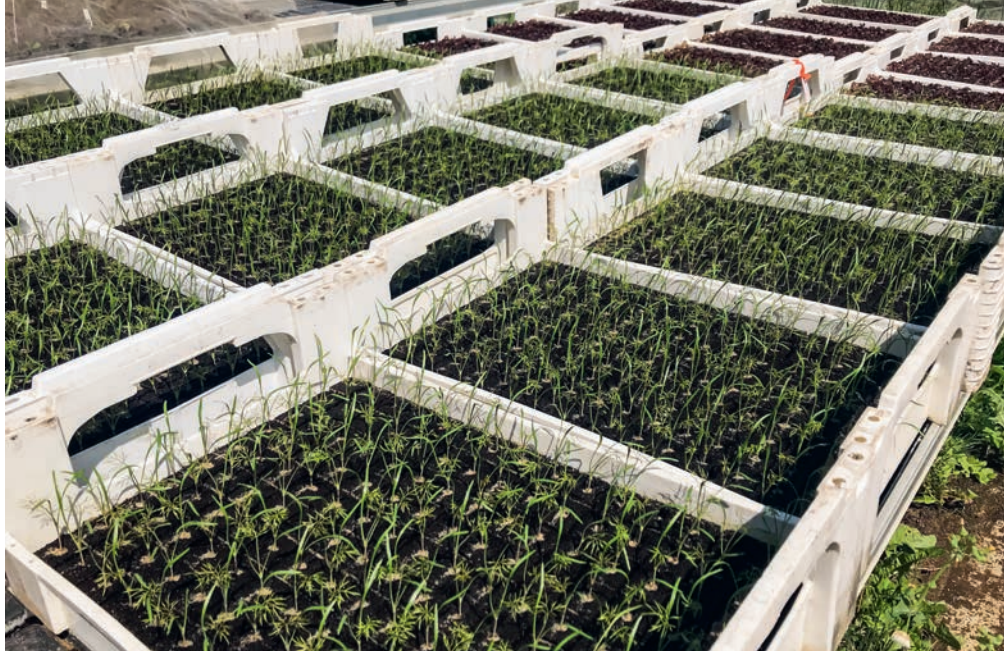
Vor allem bei der Anzucht von Setzlingen hat sich der Einsatz von Pflanzenkohle als vorteilhaft erwiesen, wenn sie direkt im Wurzelraum appliziert wird.

«Wir benötigen weitere Studien, vor allem direkt in der Schweiz. Es muss weiter geprüft werden, vor allem in Bezug darauf, welcher Bedarf für die Verbesserung des Wasserhaushalts oder der Nährstoffverfügbarkeit besteht. Das höchste Potenzial für eine Ertragszunahme besteht in sauren, humusarmen und sandigen Böden, die es nur in der Westschweiz gibt. Wir dürfen nicht Fehler wiederholen, die man nicht mehr beseitigen kann, wie das beim Eintrag von Klärschlamm in den 1980er-Jahren geschehen ist», warnt Gudrun Schwilch. «Schweizer Böden brauchen eigentlich keine Pflanzenkohle! Unser Boden ist eine sehr wertvolle Ware, die sich nicht mehr ersetzen lässt. Zuerst muss gründlich geprüft werden,