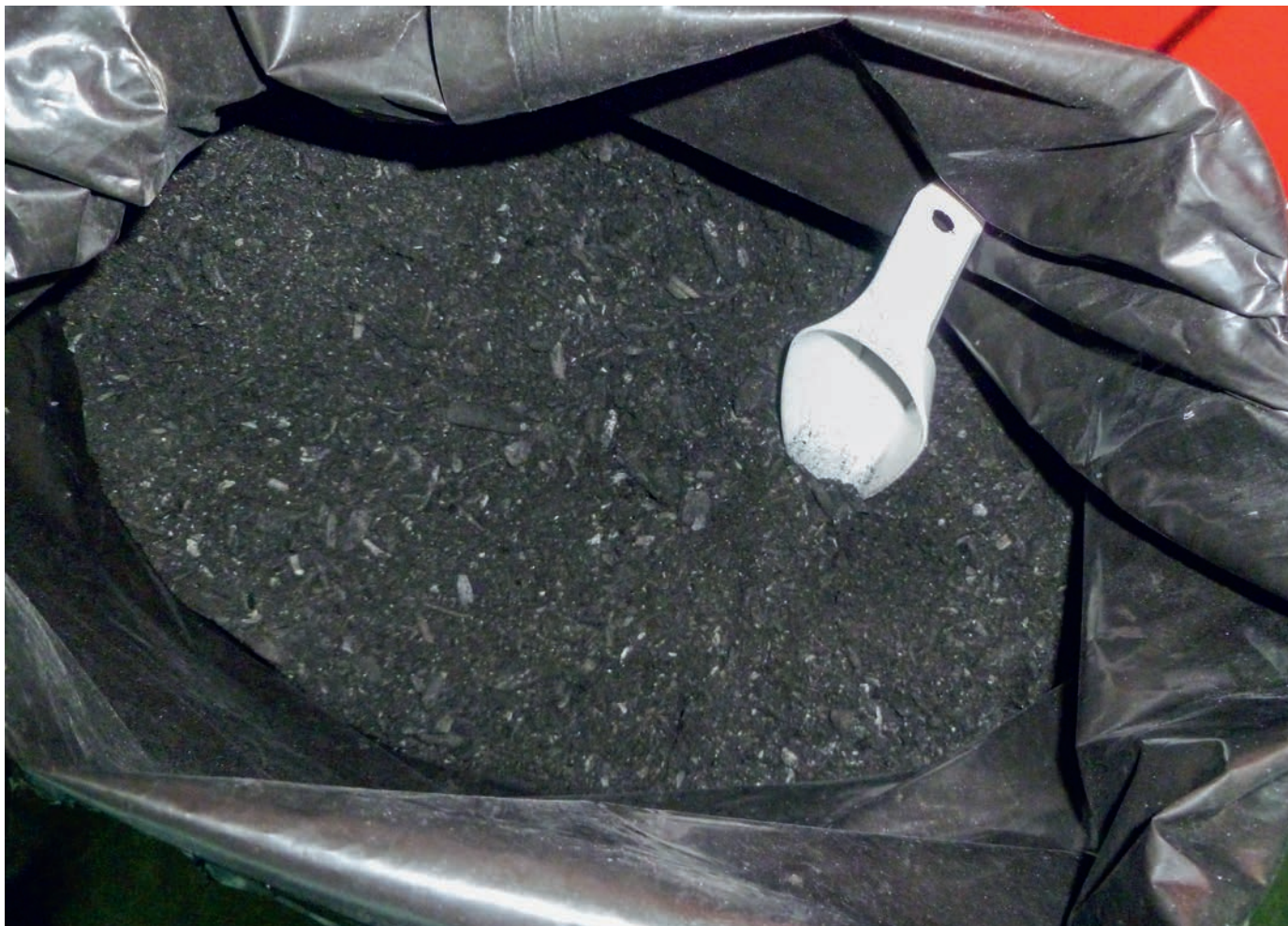
Sie sieht aus wie Holzkohle, birgt aber wesentlich mehr Potenzial: Pflanzenkohle bindet nicht nur CO 2 , sie kann Böden verbessern und besitzt eine hohe Wasseraufnahmefähigkeit. Studien haben gezeigt, dass die Pflanzen resistenter sind, sich beispielsweise die Wurzeln besser entwickeln.