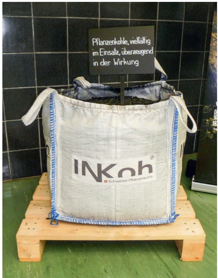
Pflanzenkohle wird von vielen Herstellern in diversen Qualitäten angeboten. Kontrollen und Analysen garantieren, dass mit ihnen keine Schadstoffe in die Umwelt gelangen.

Pflanzenkohlen unterscheiden sich in ihrer Zusammensetzung, also auch in der Qualität. Diese Unterschiede müssten weiter